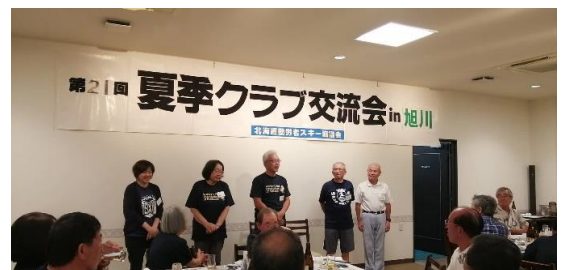
クラブ紹介 スカディの参加者