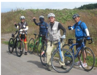
サイクリングの面々

8日は旭岳・姿見の池散策に参加、晴天に恵まれロープウェイ駅から第5展望台へ。噴煙を間近に見て、姿見展望台に建つ平和の鐘を鳴らす。青空のもと遠くの山々まで見え、紅葉が始まった風景を楽しめた。 菅