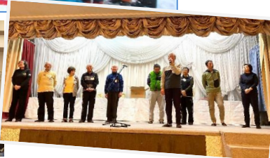
壇上でクラブ紹介