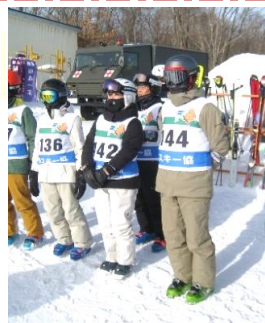
実技前のミーティング