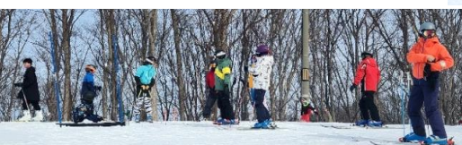
ゲート前で順番待ち