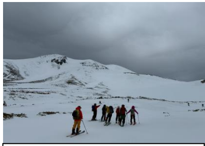
剣が峰を目指して!