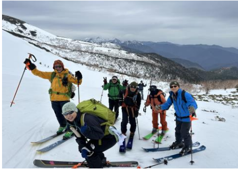
東京に転居されたNさんと再開!

登り始めは結構な急斜面に汗をかき、そこを過ぎると割と歩きやすい斜面に変わるが、登るに連れて風が強くなって来る。途中エコーライン(標高2650m)辺りを過ぎると、いよいよ風が強くなり