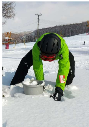
スキーまつり バケツに雪を詰めて