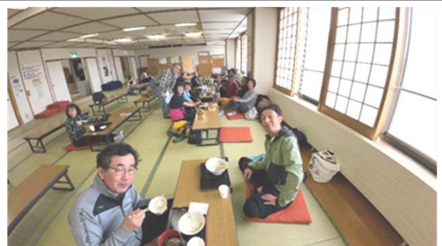
京極温泉で🍷・ご飯・♨️でまったり！