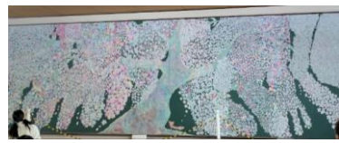
↑ 24時間TVで放送されたチョーク画がありました。

美唄の難点は屋食でした。上の写真のロッジは休憩所でカップラーメンはおいていましたが食堂はなく、どこにあるんだ?と係の人に聞くと車を停めた近くの体育館が土日のみ開いているようです。メニューはラーメン、うどん、カレー、容器は使い捨てでした。