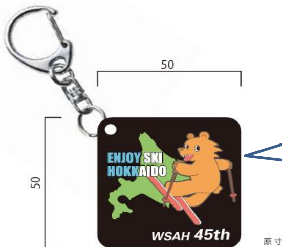
アクリル3mm厚 片面印刷

45周年記念「すべるべあー」のキーホルダーを作成いたします。 指導員。祝賀会参加者には配布いたします。